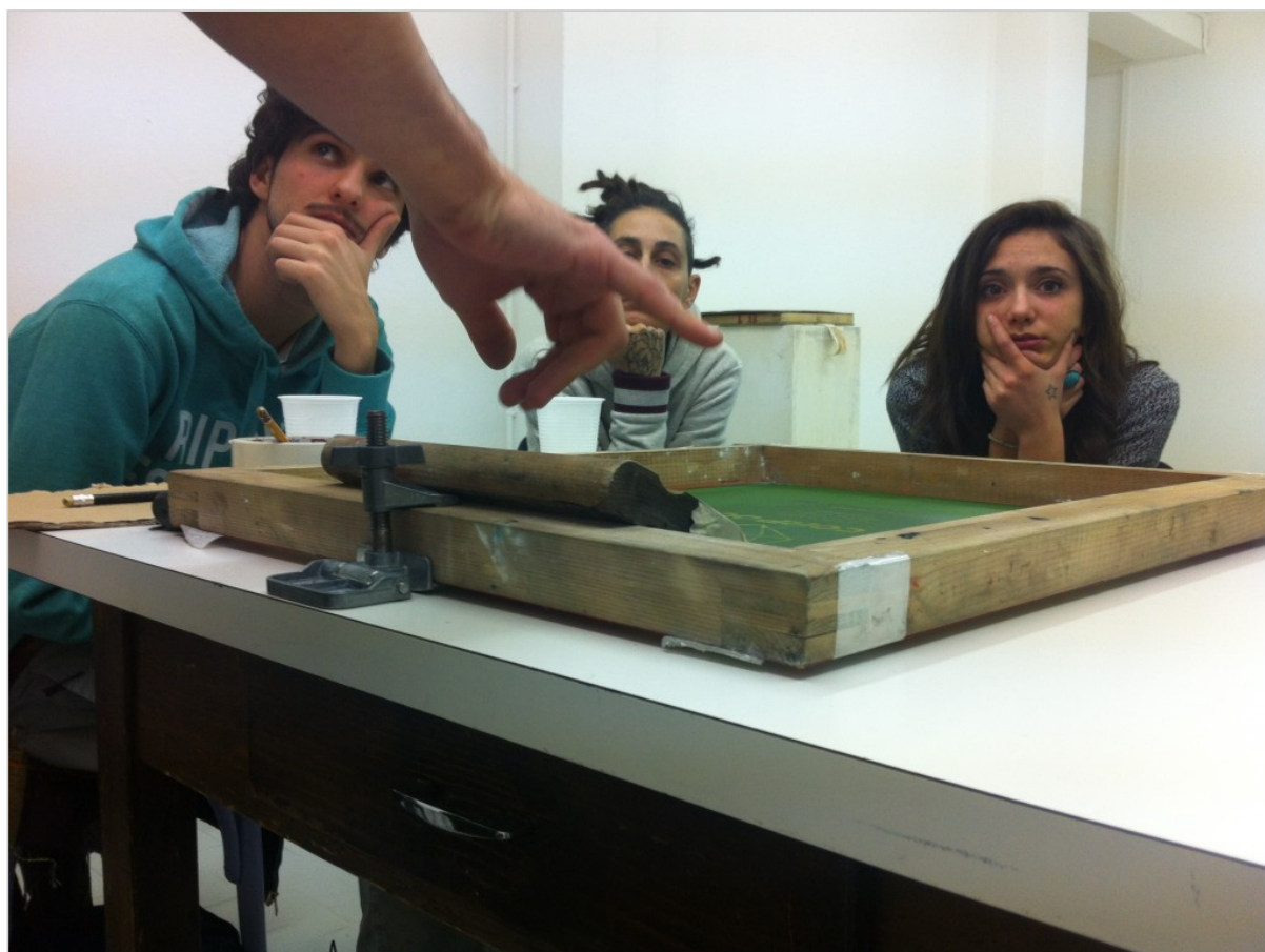
Un altro momento del workshop