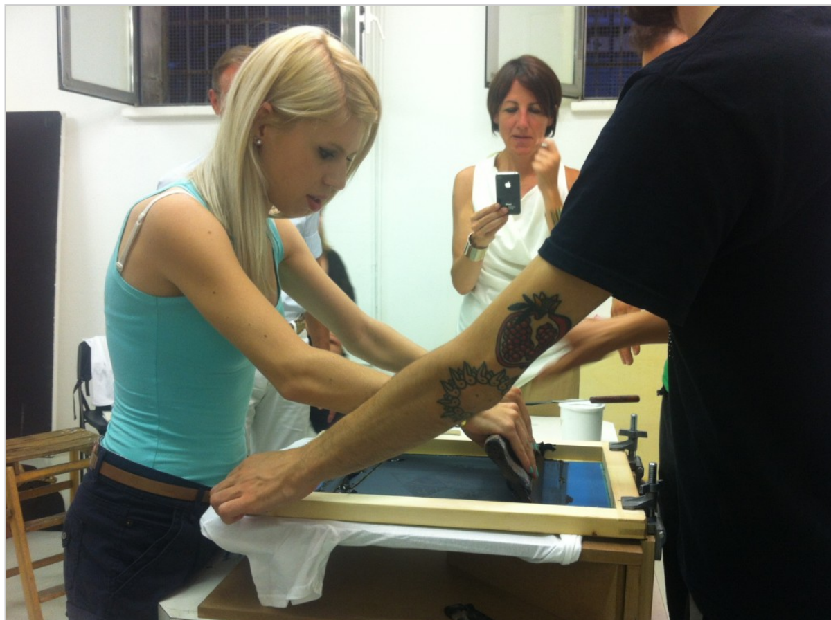
Prove pratiche di stampa durante uno dei workshop di Associazione MUR

prossima faccia potrebbe essere la vostra!