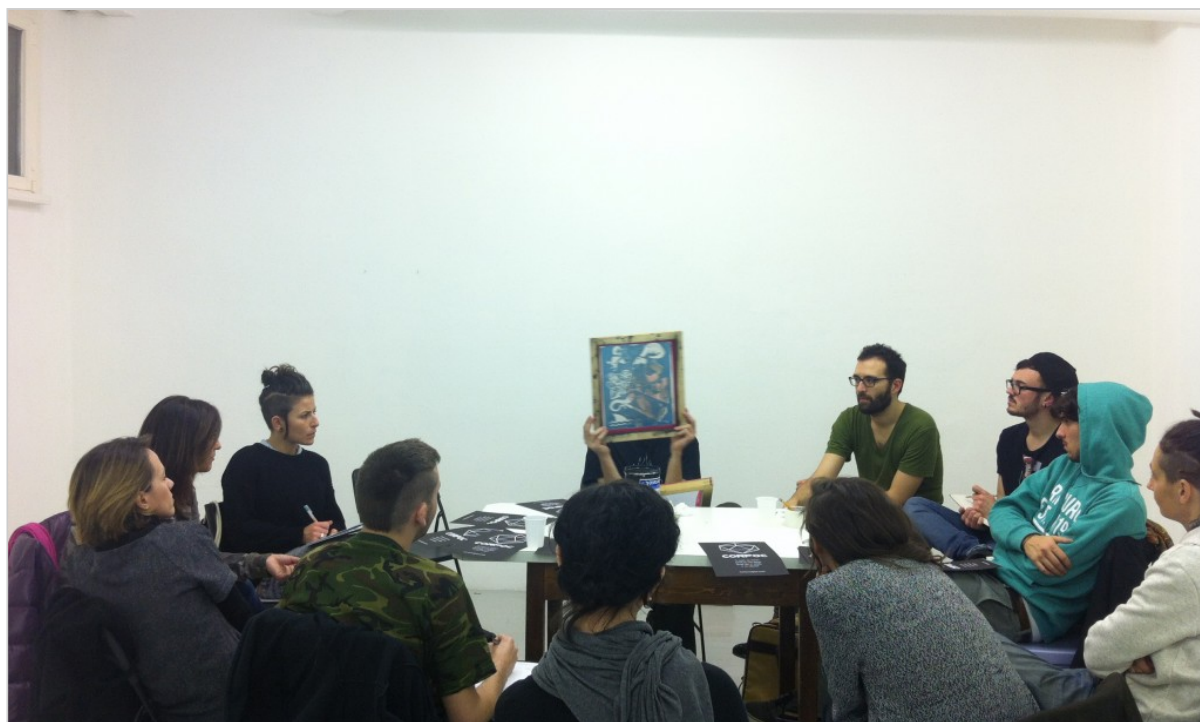
I ragazzi fanno conoscenza del telaio durante un workshop

Il pubblico che partecipa ai nostri workshop è molto eterogeneo. Le aspettative sono diverse: alcuni sono più orientati alla sperimentazione, altri alla produzione. Il workshop soddisfa entrambi i profili in quanto fornisce la padronanza dell'intero processo di stampa. Questo permette sia allo sperimentatore di provare a superare nuovi limiti, che al partecipante orientato alla produzione di far proprie delle nozioni tecniche e di gestione necessarie per l'avvio di una prima produzione.