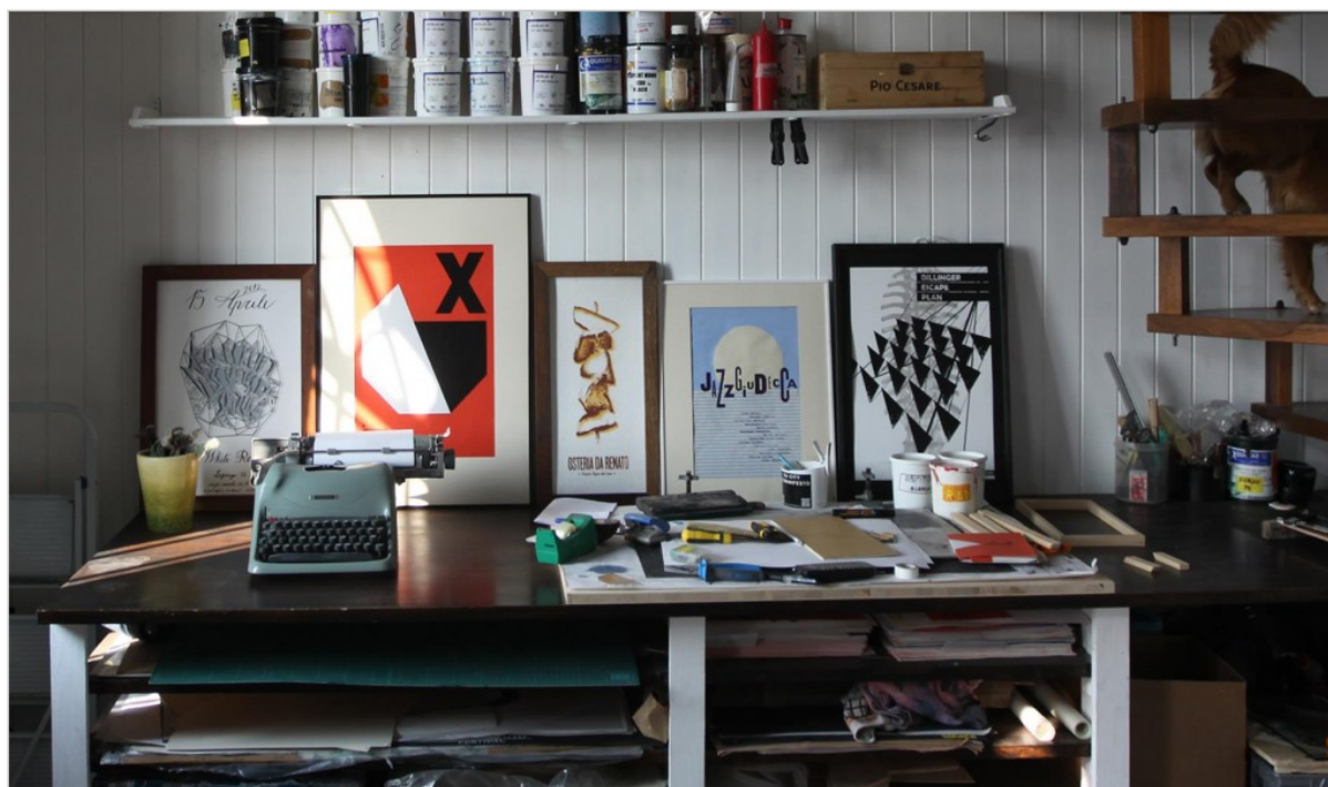
small caps, il laboratorio

Una finestra in affaccio sul Canale della Giudecca, una paratia mobile per bloccare l'acqua alta, un soppalco con un bagno/camera oscura/camera luminosa di 2 mq, mai abbastanza libri, 3 piante, 3 tavoli. Poi il resto per lavorare e abbiamo finito lo spazio disponibile.