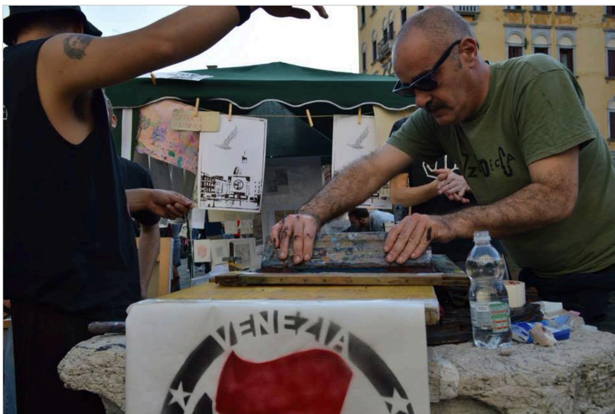
small caps fa serigrafia dal vivo

Una cosa annoiante: assemblare le lastre in acetato.