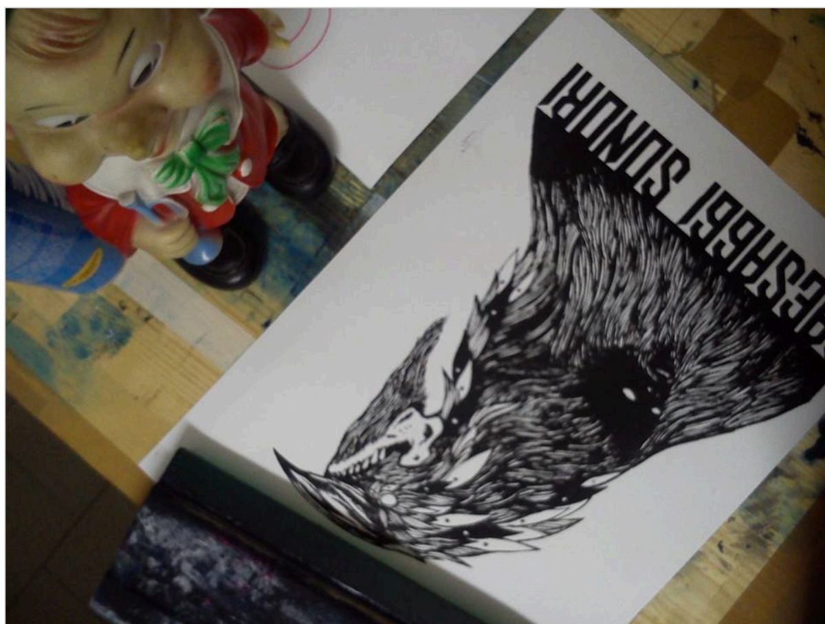
Serigrafia su carta

Bisogna sempre guardare alle caratteristiche del risultato finale che si vuole ottenere per usare i materiali giusti, senno' l'errore è dietro l'angolo.