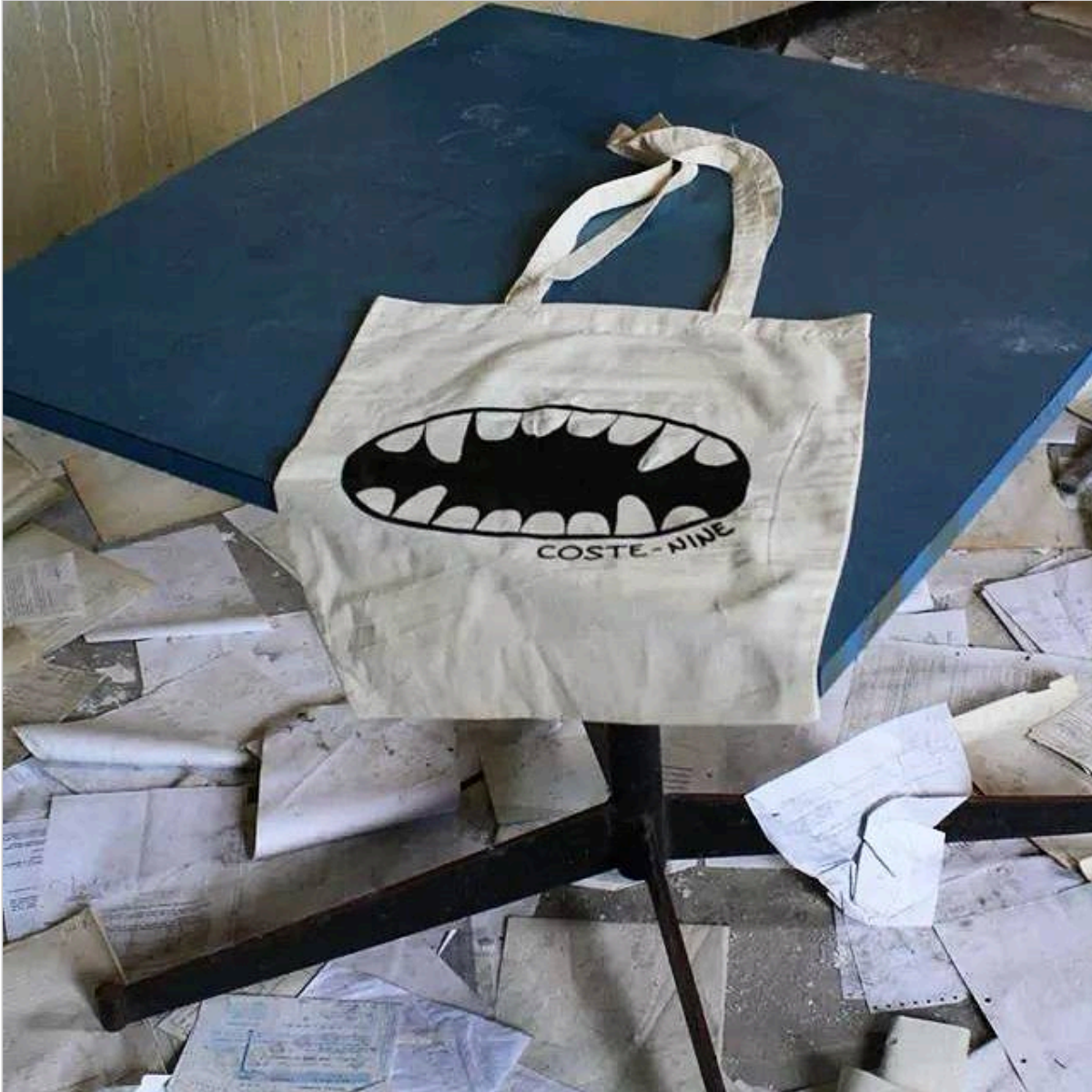
Una borsa shopper serigrafata con il logo di Coste-nine